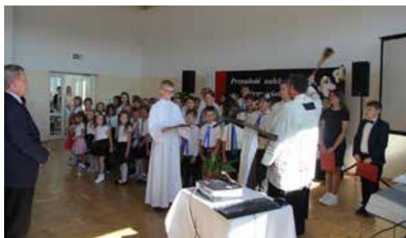
Poświęcenie nowego obiektu