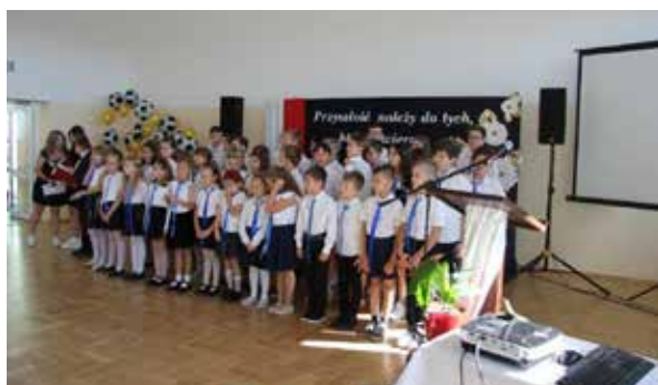
Występ dzieci i młodzieży

temu przejście z jednego obiektu do drugiego, nie będzie stanowić żadnego problemu i niepotrzebnych perturbacji.