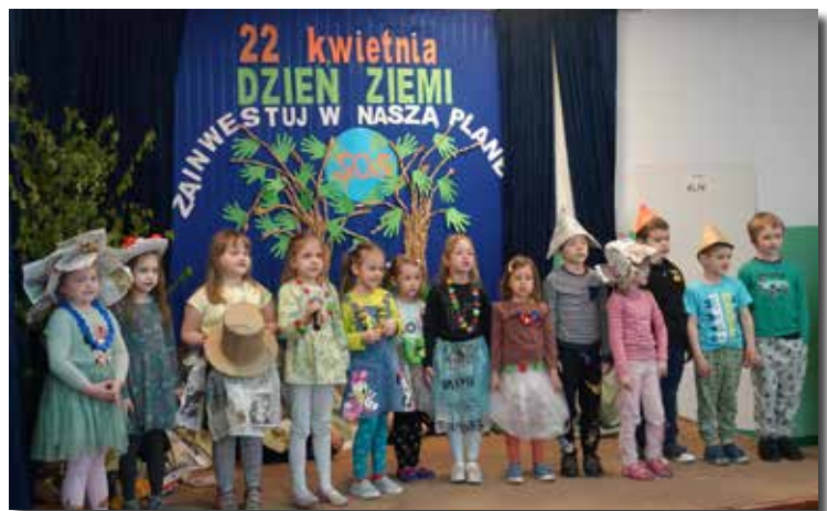
SP Ostrowy Tuszowskie