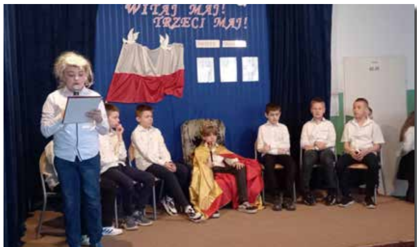
Szkoła Podstawowa w Ostrowach Tuszowskich