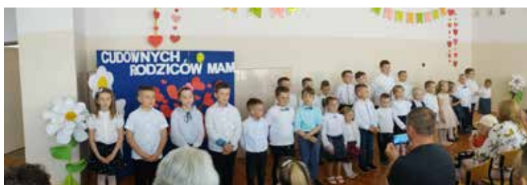
Szkoła Podstawowa w Porebach Dymarskich