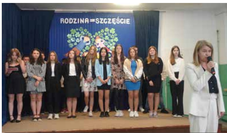
Szkoła Podstawowa w Ostrowach Tuszowskich