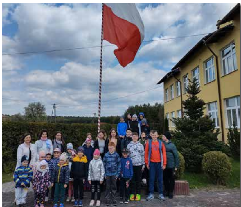
Szkoła Podstawowa w Porębach Dymarskich