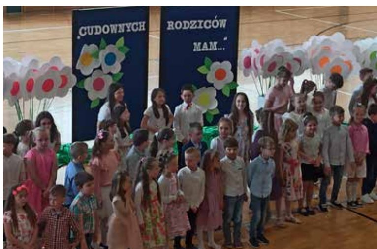
Szkoła Podstawowa w Cmolasie