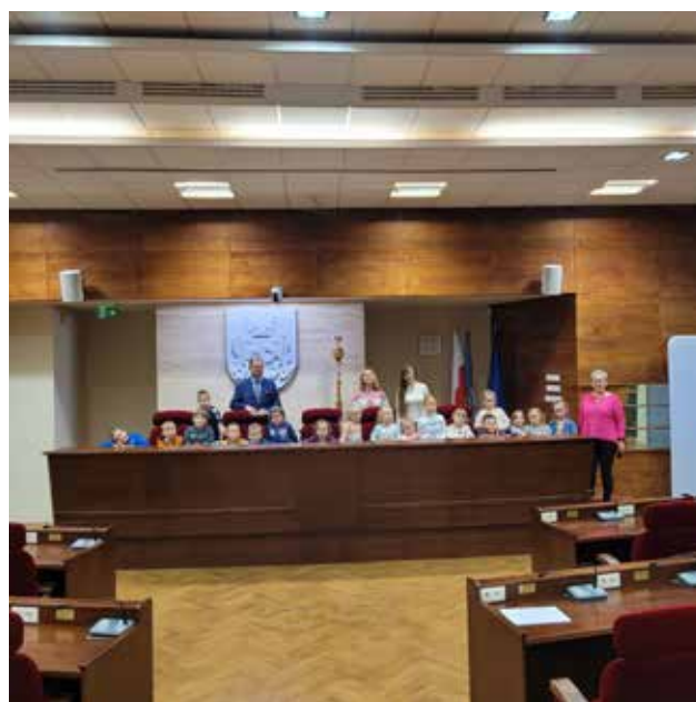
W Urzędzie Marszałkowskim