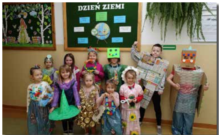
SP Ostrowy Baranowskie