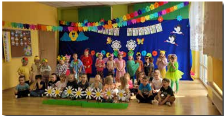
Uroczyste Powitanie Wiosny