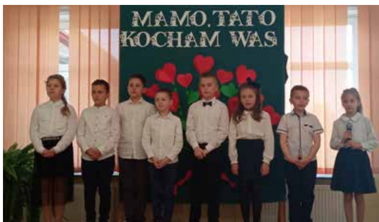
Szkoła Podstawowa w Ostrowach Baranowskich