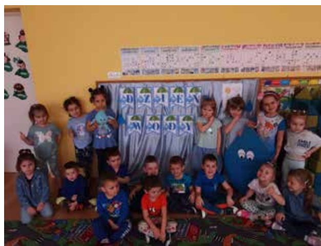
„Woda, to życie” – Światowy Dzień Wody