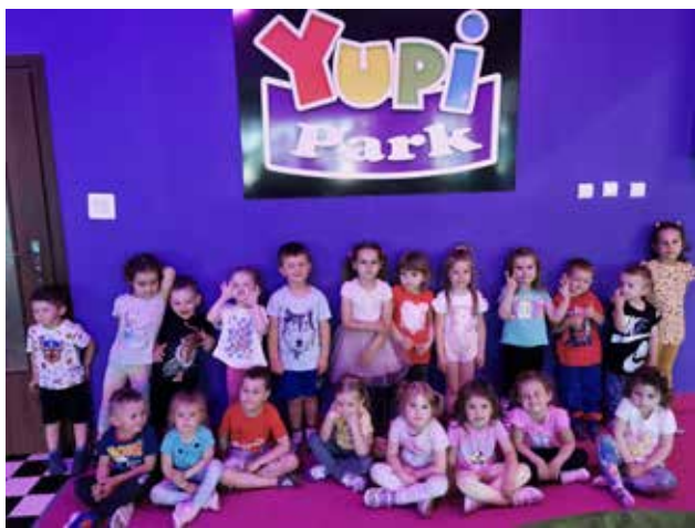
W Yupi Parku