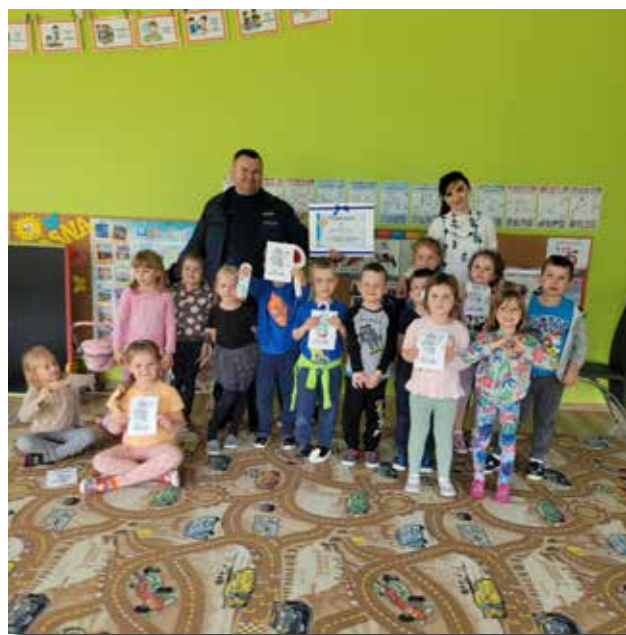
Spotkanie z policjantem