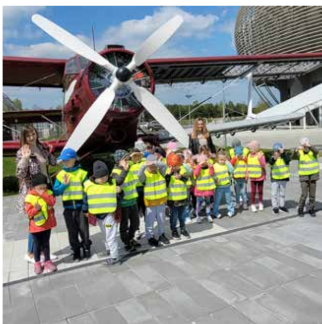
W Centrum Nauki Łukasiewicz