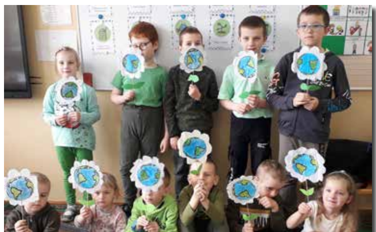
SP Poręby Dymarskie