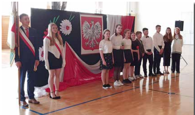
Szkoła Podstawowa w Cmolasie