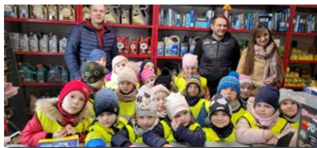
W MZ Auto