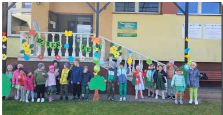
Chroń Ziemię – bądź jej przyjacielem!