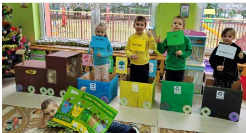
„Pociąg do segregacji”

zainteresowania najmłodszych, przedszkolaki w ramach ogólnopolskiego projektu „Zabawa sztuką” w lutym br. stworzyły własny