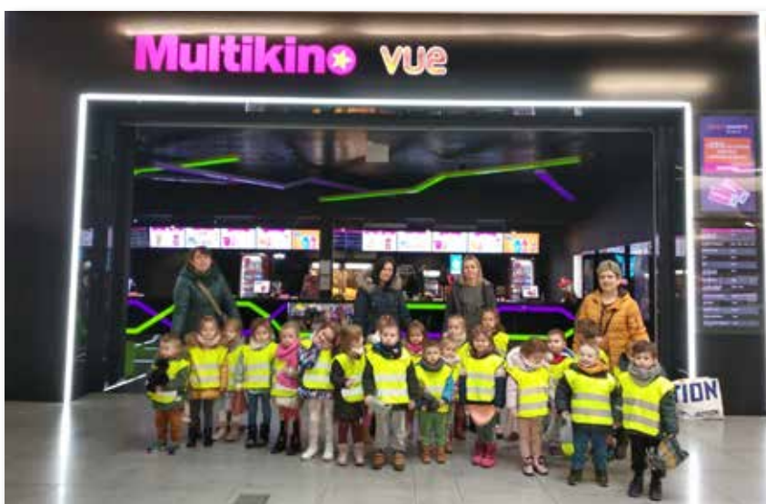
Wycieczka do kina

Dnia 3 marca, grupy przedszkolne: „Biedroneczki” oraz „Misie” z Akademii Przedszkolaka w Cmolasie, wybrały się na wycieczkę do Multikina w Mielcu. Dzieci miały okazję obejrzeć film animowany pt.: "Wróżka Zębuszka". Bajka opowiadała o sympatycznej Violetcie, która szkoliła się, żeby zostać Wróżką Zębuszką i móc wręczać dzieciom prezenty w zamian za ich mleczne zęby. Niestety mimo szczerych chęci wciąż oblewała egzaminy, bo jedyne upominki, które potrafiła wyczarować to... fioleto-we kwiaty. A przed nią najważniejszy, doroczny sprawdzian. Kiedy i ten skończył się porażką, Violetta podkraśla innej wróżce magiczny klejnot teleportacji i z jego pomocą przeniknęła do naszego świata. Wszystko po to, by udowodnić niedowiarkom, że może być świetną Zębuszką. Pech chciał, że w trakcie lądowania w ludzkiej rzeczywistości skradziony klejnot uległ uszkodzeniu i Violetta straciła możliwość powrotu do domu. Na szczęście poznała Maxie, z której pomocą próbowała odnaleźć tajny portal do świata magii. Ale czy uda im się dokonać niemożliwego? Przedszkolaki znają już odpowiedź na to pytanie. Film był doskonałą lekcją o pomocy i wielkiej sile przyjaźni. Wycieczka była dla dzieci dużym przeżyciem. Dzieci nie tylko wzbogaciły swoje doświadczenia, ale przypomniały sobie zasady właściwego zachowania w miejscach