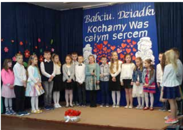
SP Ostrowy Tuszowskie