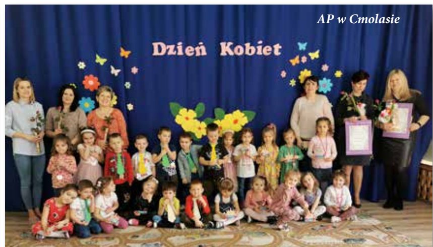
AP w Cmolasie