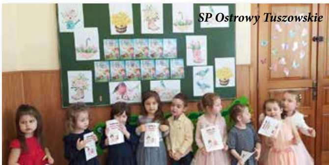
SP Ostrowy Tuszowskie