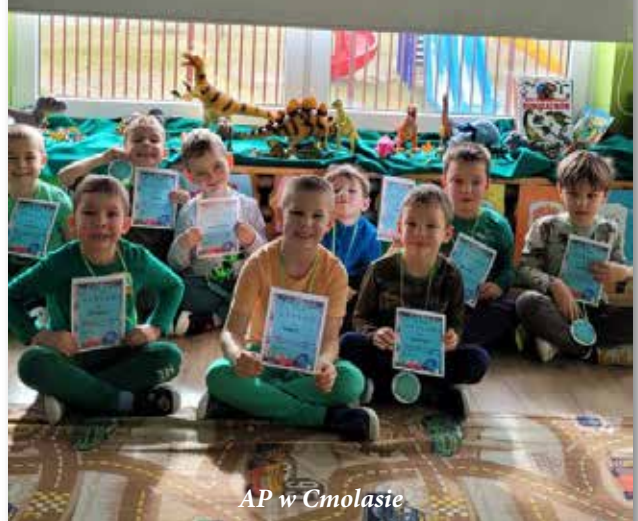
AP w Cmolasie