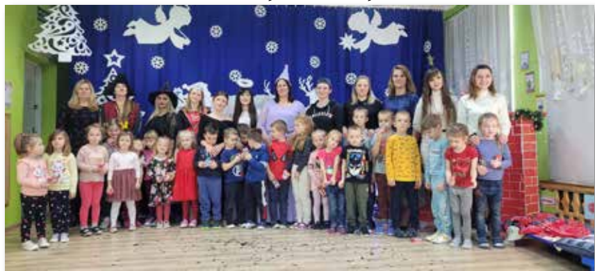
Spektakl teatralny „Rodzice - dzieciom”