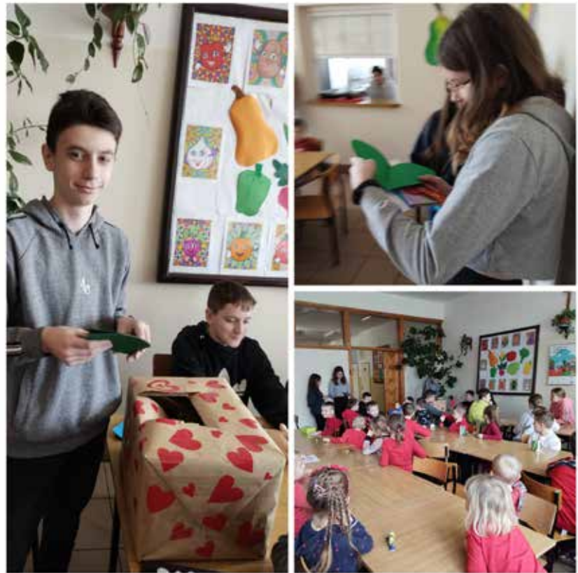
SP Poręby Dymarskie