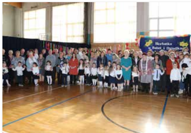
AP w Cmolasiu