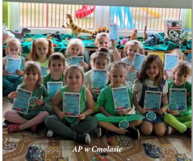
AP w Cmolasie