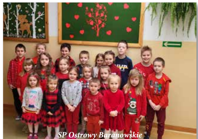
SP Ostrowy Baranowskie