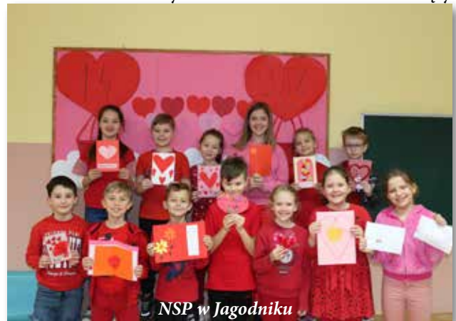
NSP w Jagodniku