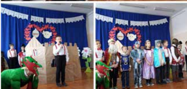
SP Poręby Dymarskie