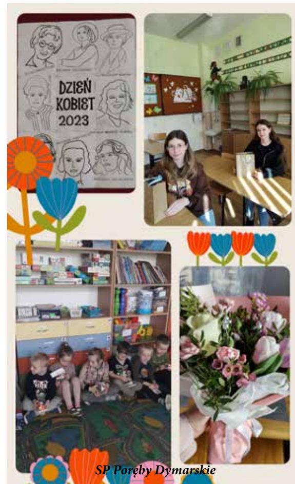
SP Poręby Dymarskie