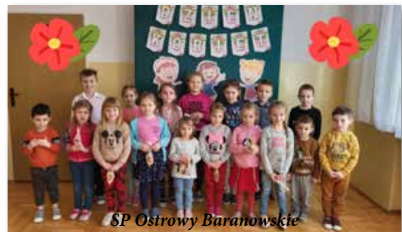
SP Ostrowy Baranowskie

Międzynarodowy Dzień Kobiet przypadający w kalendarzu na 8 marca jest świętem szczególnym. Tego dnia Panie zostają obdarowywane pięknymi kwiatami i prezentami.