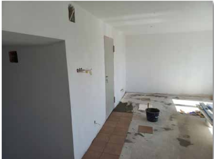
Remont budynku Zakładu Usług Komunalnych