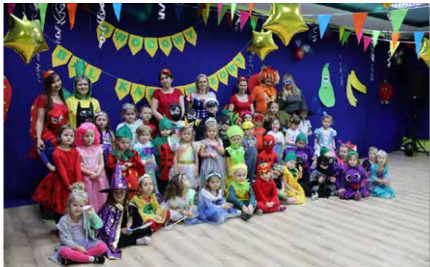
„Owocowy bal karnawałowy”

za zaangażowanie i wysiłek włożony w przygotowanie tego nadzwyczajnego przedstawienia. Gratulujemy talentu aktorskiego jednocześnie czekając na kolejne tak piękne realizacje!