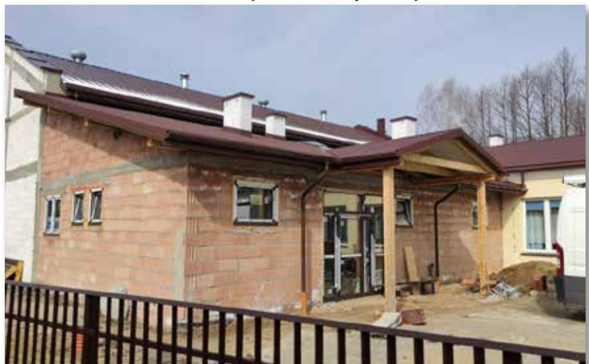
Budowa sali gimnastycznej w Jagodniku