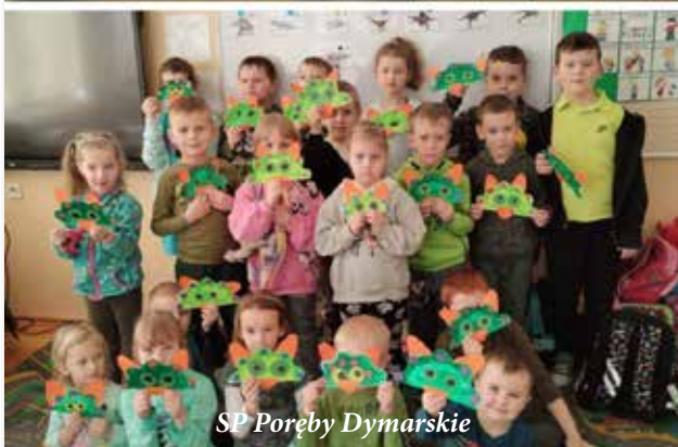
SP Poręby Dymarskie