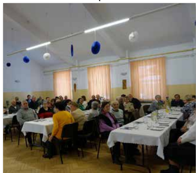
SP Ostrowy Baranowskie