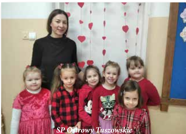
SP Ostrowy Tuszowskie