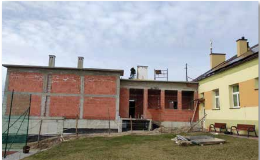
Rozbudowa Szkoły Podstawowej w Hadykówce