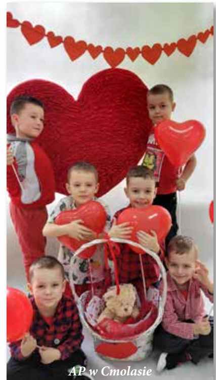
AP w Cmolasie

lutego był dla maluchów z Akademii Przedszkolaka w Cmolasie czerwonym dniem przyjaźni, życzliwości i dobroci. Dzieci wzięły